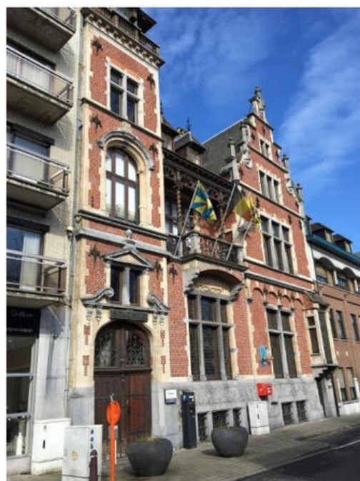
VU: Patrick De Croix, Kouterweg 6, 8870 Izegem